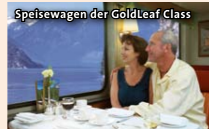
Speisewagen der GoldLeaf Class

Nicht enthalten: Trinkgelder und Ausgaben des persönlichen Bedarfs, nicht genannte Mahlzeiten und Getränke