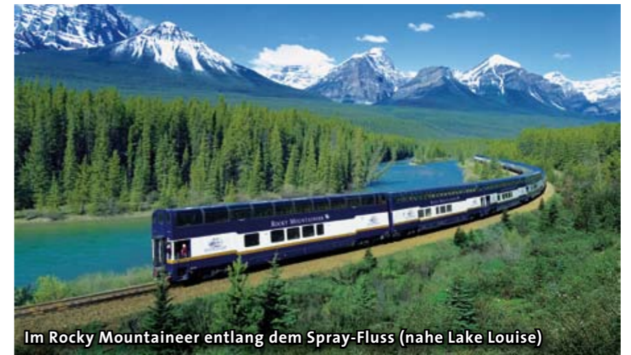
Im Rocky Mountaineer entlang dem Spray-Fluss (nahe Lake Louise)