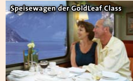
Speisewagen der GoldLeaf Class

Nicht enthalten: Trinkgelder und Ausgaben des persönlichen Bedarfs, nicht genannte Mahlzeiten und Getränke