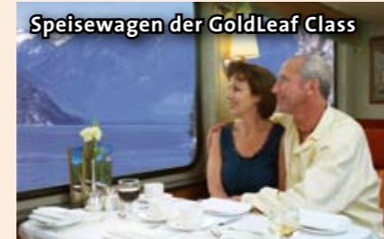
Speisewagen der GoldLeaf Class

Nicht enthalten: Trinkgelder und Ausgaben des persönlichen Bedarfs, nicht genannte Mahlzeiten und Getränke